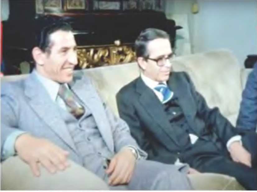
جانب من مباحثات رئيس وزراء ليبيا عبد السلام جلود أثناء زيارته لروما بشأن البترول مع وزير الداخلية ماريانو رومور، ووزير الخارجية ألدو مورو، إيطاليا، 1974 / 2 / 22 .